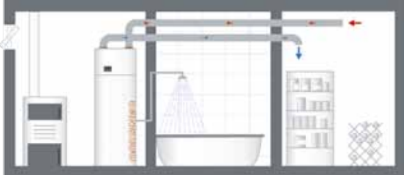
BEISPIEL A (Type Europa 250 DK/DKL, 323 DK und Mini IWP)