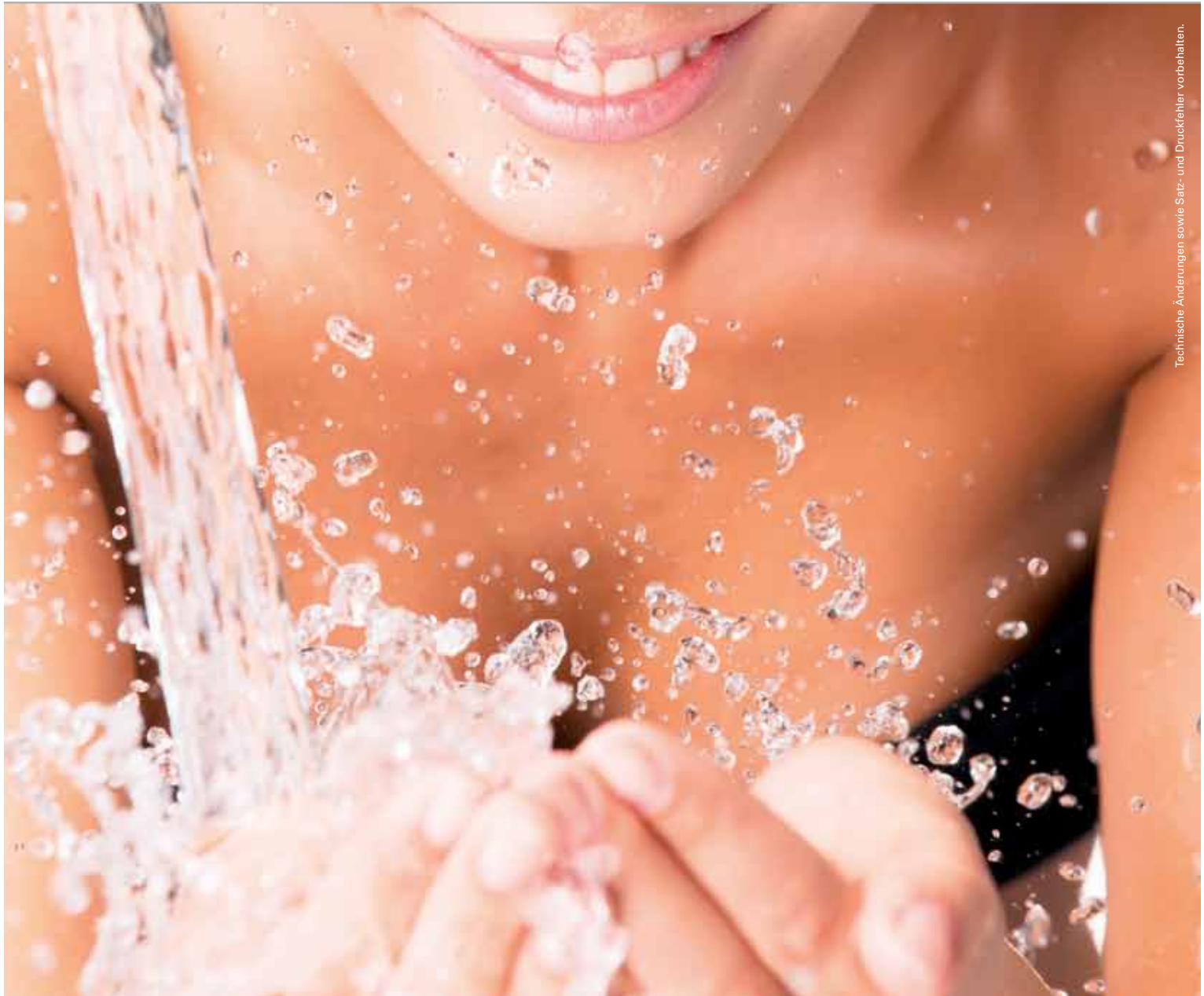
Technische Änderungen sowie Satz- und Druckfehler vorbehalten.