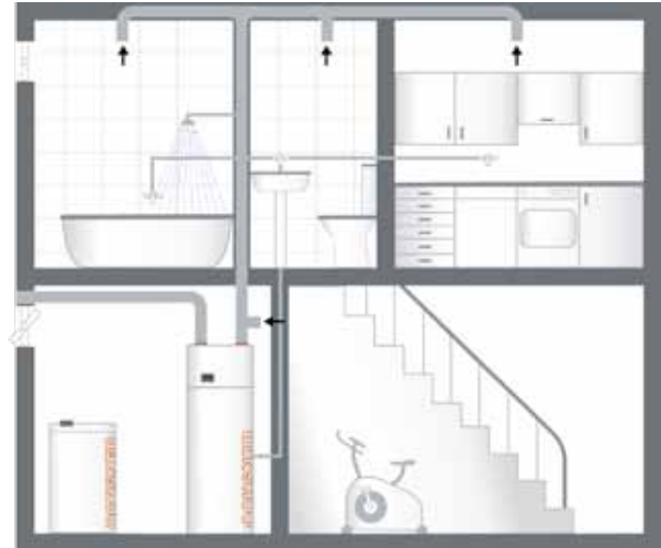
BEISPIEL C (Type Europa 323 DK)